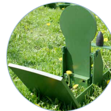
Мишень "Неваляшка 200"