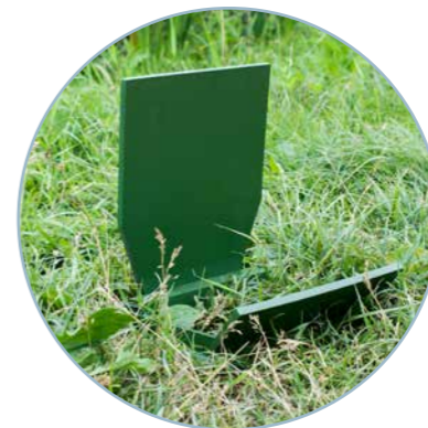
Мишень "Неваляшка мини 5А"