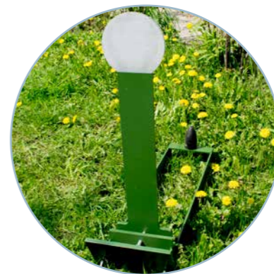
Поппер "Мини КС"