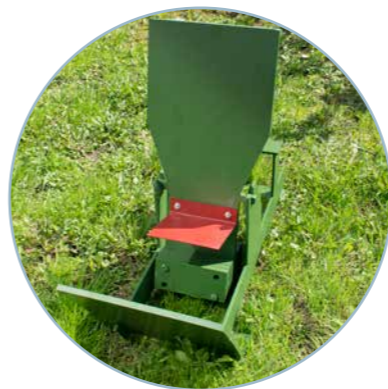
Мишень "Неваляшка 5А"